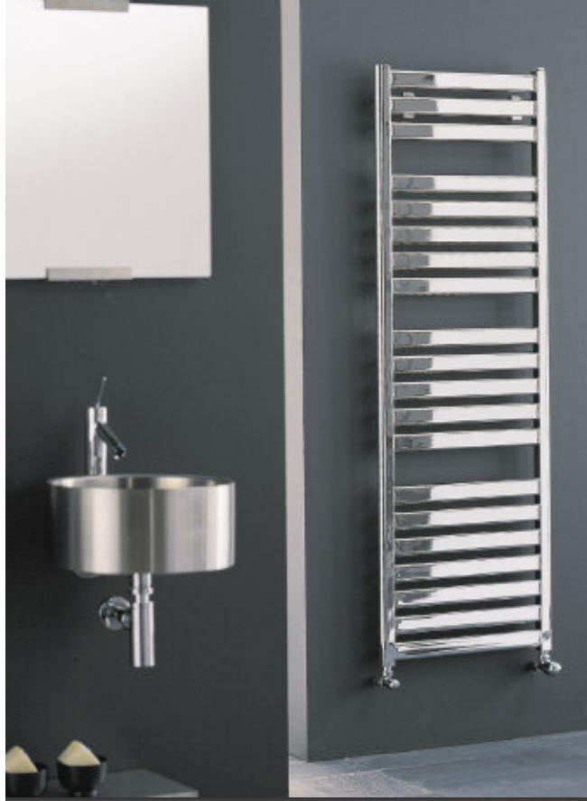
In fotografie: Calorifer Vela Cromat. Înălțime mm 1610, lățime 560, culoare Cromat (cod. 50).