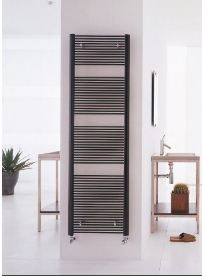
În fotografie: Calorifer Filo. Înălțime mm 1709, lățime 516, culoare Maro (cod. 09).