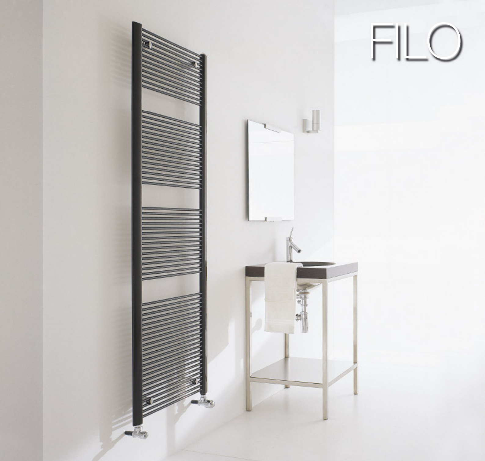
Calorifer vopsit în culoarea Maro (cod. 09)