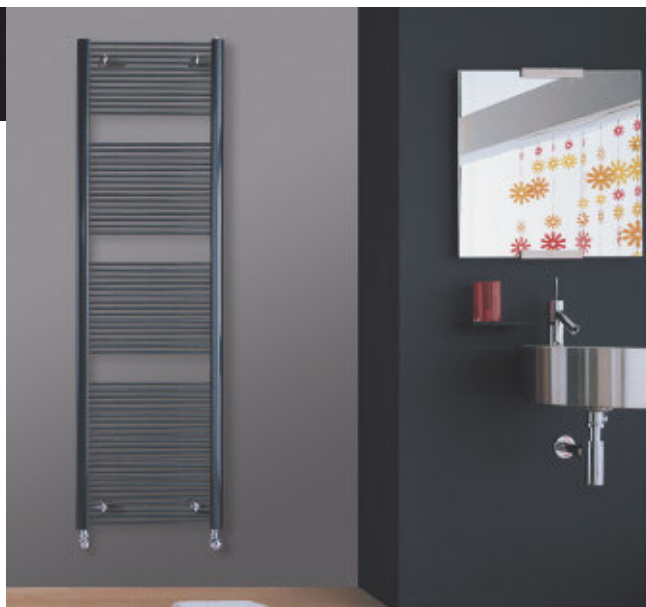
Calorifer Filo vopsit în culoare Gri Quart (cod. 31)

O idee a IRSAP-ului care devine o propunere de decor.