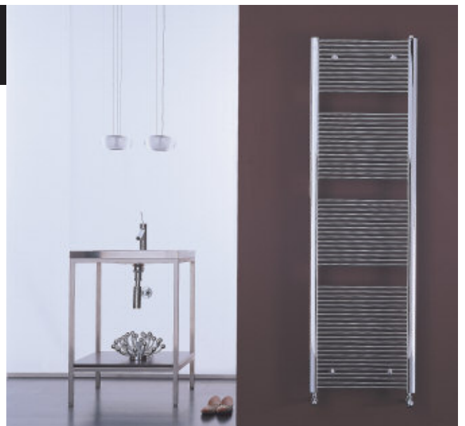
Calorifer Filo Cromat (cod. 50)

Datorită liniei noi și atrăgătoare, caloriferului FILO, versiunea cromată , devine protagonist în orice tip de decor (și ambient).