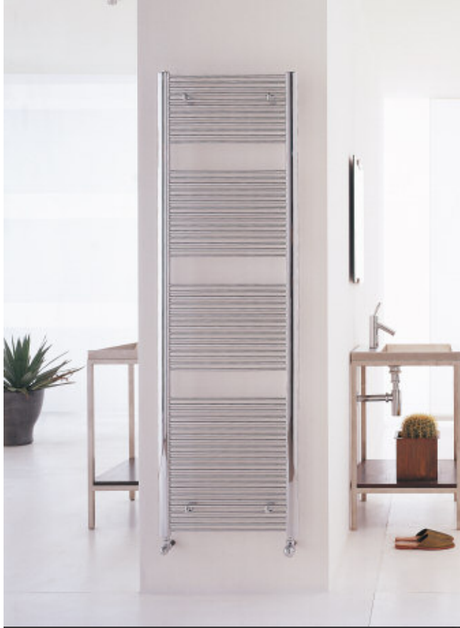
In fotografie: Calorifer Filo Cromat. Înălțime mm 1709, lățime 516, culoare Cromat (cod. 50).