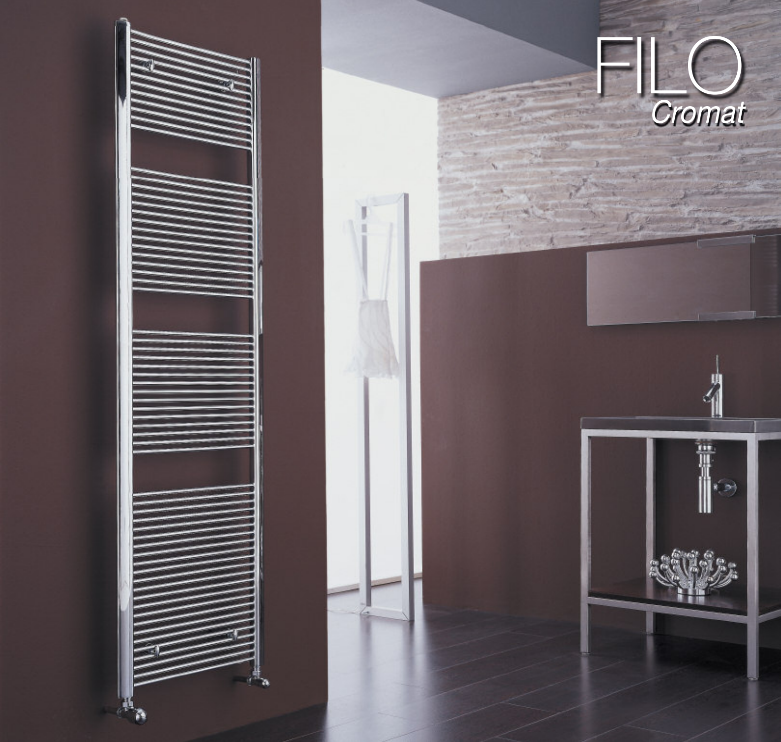
Calorifer Cromat (cod. 50)