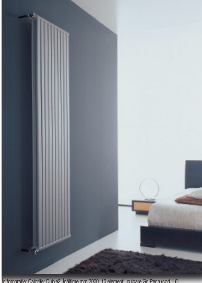
In fotografie: Calorifer Duple2. Înălțime mm 2000, 10 elemente, culoare Gri Perla (cod. L6).