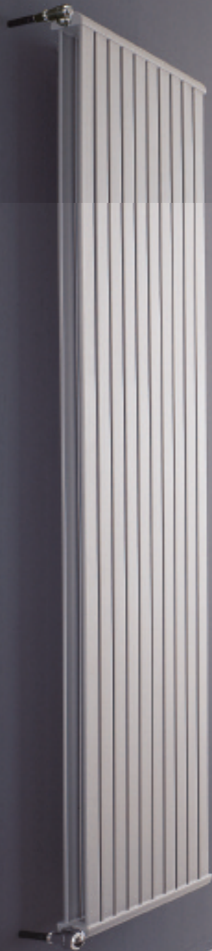
Calorifer vopsit în culoarea Gri Perla (cod. L6)