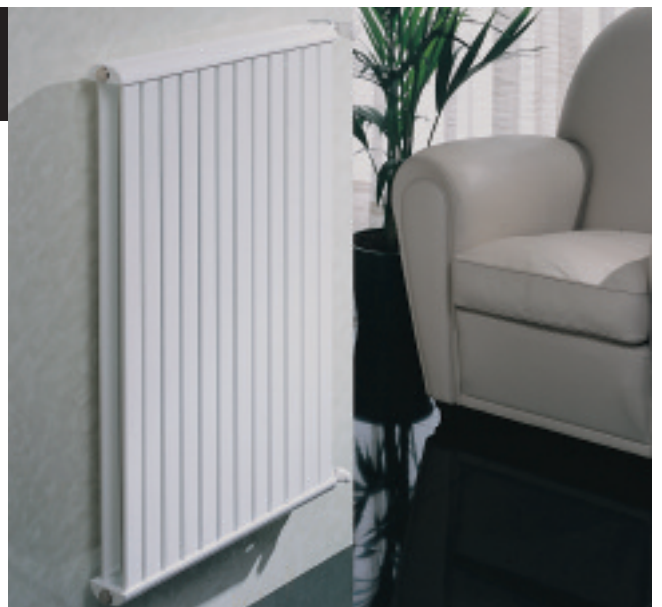
Calorifer Duple 2 vopsit în culoare Alb Standard (cod. 01)

DUBLE 2 reprezintă evoluția tehnică și funcțională a caloriferului Duple. Crește suprafața și sarcina de schimb termic a caloriferului DUBLE menținând caracteristicile constructive și estetice. Este în mod particular adecvat pentru a fi instalat în locuri spațioase de mare cubaj unde caloriferul normal DUBLE nu ar fi suficient pentru a produce căldura necesară. Înălțimi cuprinse între 500 și 2500 mm și lungimi între 10 și 40 de tuburi.