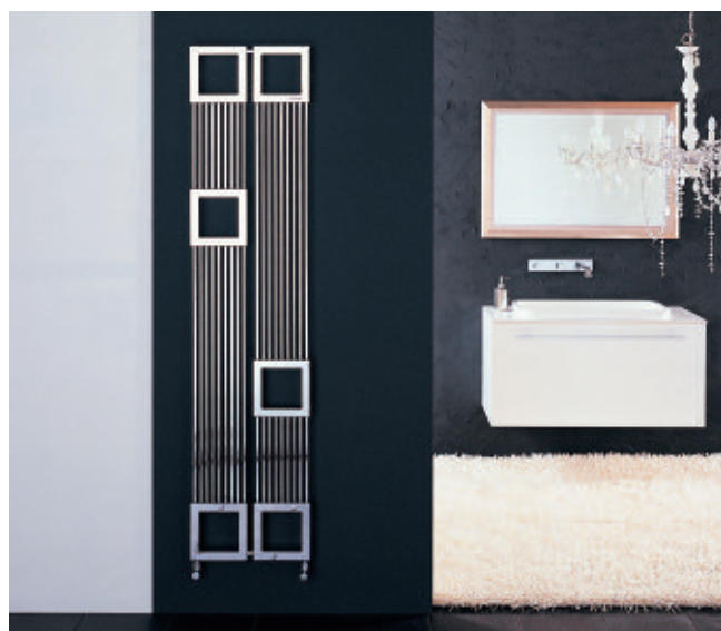
Calorifer Cromat (cod. 50)

Forma B, calorifer modular, este piatra filozofală a unei noi concepții de design dedicat încălzirii. Încăperea pare un luminiș, iar Forma B e simbolul său expresiv, semnul unei calde prezențe.