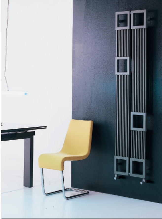
În fotografie: Calorifer Forma B Vert. 2 module. Înălțime mm 1804, lățime mm 420, culoare Gri Perla (cod. L6).