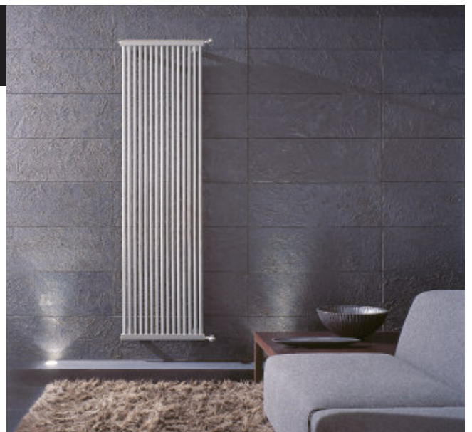
Calorifer vopsit în culoare Gri Titanu Metalizat (cod. L3)

Minunata sinteză între funcționalitate și estetică stă la originea numelui acestui calorifer din oțel. Structura tubulară de mare randament, design-ul simplu și liniar fac în așa fel încât caloriferul SINTESI să fie recomandat în mod particular pentru instalațiile de joasă temperatură. Soluțiile care îl compun sunt infinite, cu înălțimi cuprinse între 500 și 2500 mm și lungimi între 4 și 54 de tuburi.