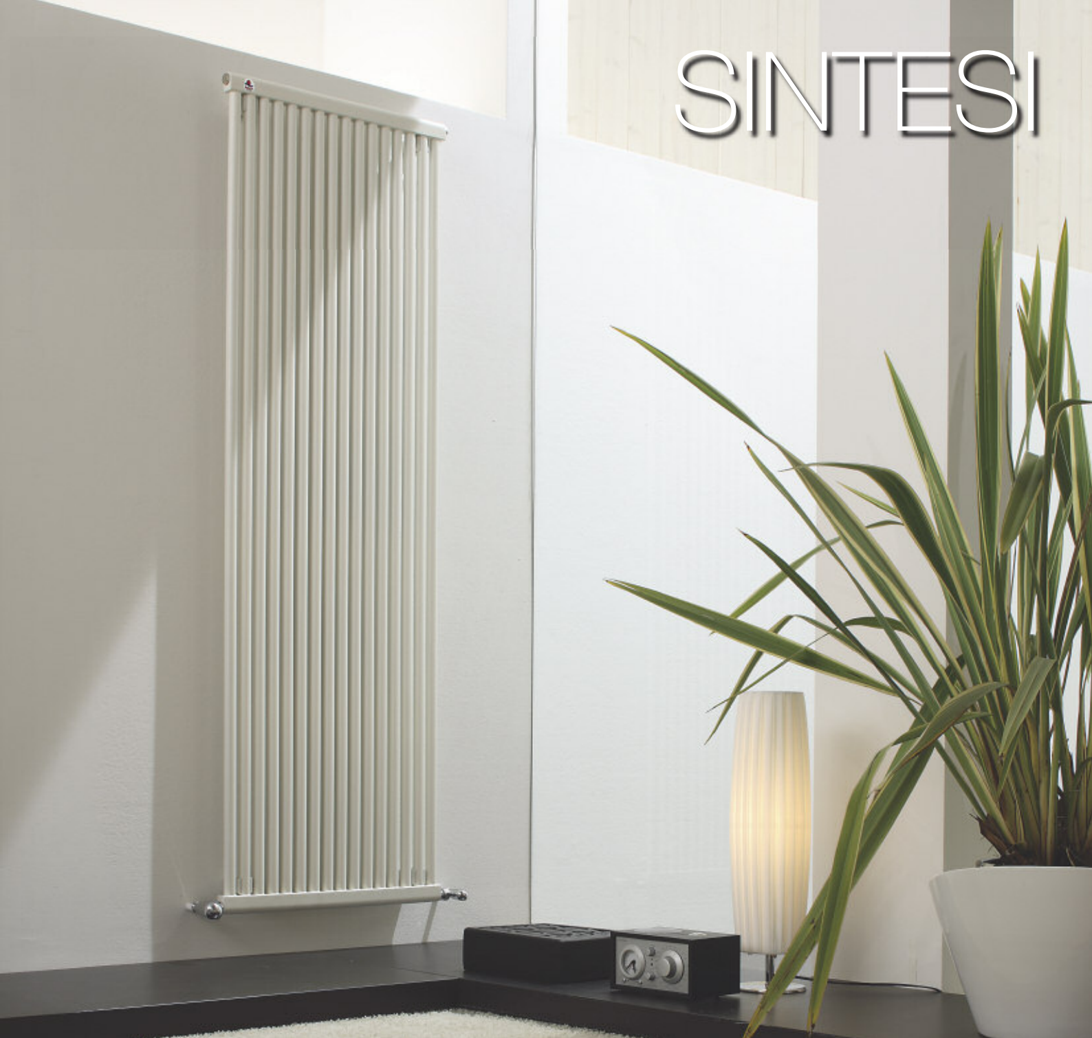
Calorifer vopsit în culoarea Alb Perla (cod. 16)