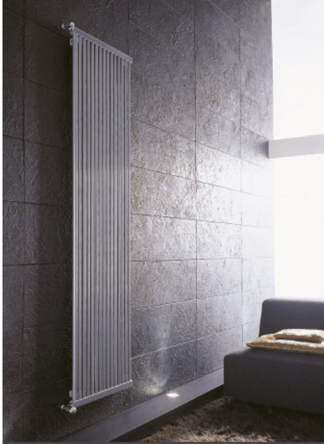
În fotografie: Calorifer Sintesi. Înălțime mm 2000, 15 elemente, culoare Gri Titaniu Metalizat (cod. L3).