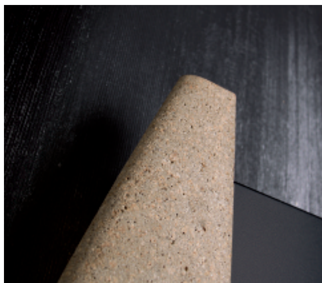
Deetaliu calorifer Stenos electric.

STENOS creează o atmosferă de elegantă ospitalitate.