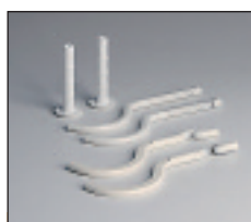
Console standard pentru Tesi