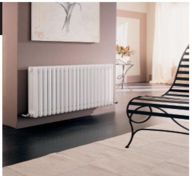
Calorifer Tesi 4 vopsit în culoarea Alb Standard (cod. 01)

"Termomobilierul®" TESI reprezintă cel mai elegant și funcțional sistem de încălzire a încăperilor. Structura sa tubulară din oțel permite folosirea optimă a energiei, garantând un randament elevat, chiar și în cazul instalațiilor ce funcționează la temperaturi nu foarte ridicate. O altă particularitate a acestui produs este extraordinara sa modularitate, datorată unei vaste game de dimensiuni disponibile: 5 lățimi, 19 înălțimi, lungimi nelimitate multiple de 45 mm. De aceea modelele TESI sunt folosite la lucrările de recuperare și recondiționare ale vechilor instalații. Datorită formelor rotunjite, care reduc la minim riscul accidentelor, modelele TESI pot fi utilizate în locuri publice, în birouri, în școli și în spitale.