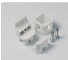
Chele pentru fixare perete Tesi