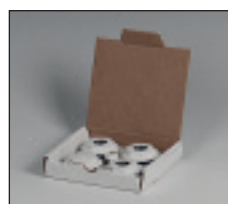
Kit dopuri și reducerii instalație Tesi