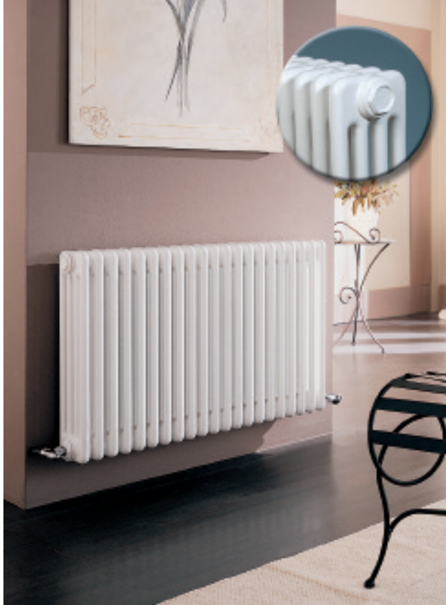
In fotografie: Calorifer Tesi 4. Patru coloane, Înălțime mm 750, 21 elemente, culoare Alb Standard (cod. 01).