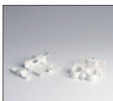
Console universale pentru Tesi