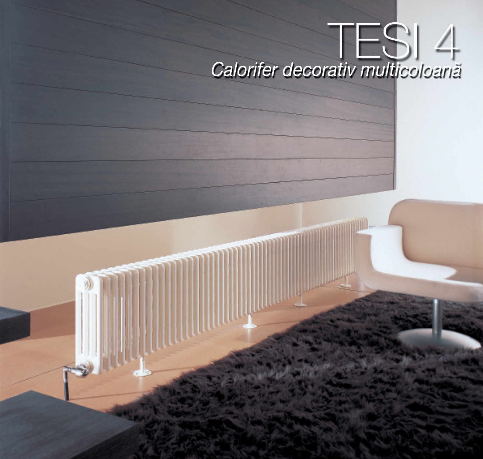
Calorifer vopsit în culoarea Alb Standard (cod. 01)